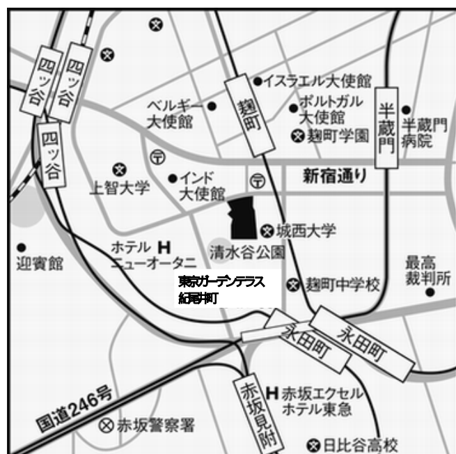
最寄駅からのご案内